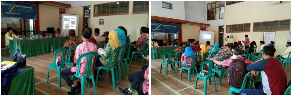
Gambar 1. Dokumentasi Pelatihan

Saat kegiatan ini berlangsung ditemukan beberapa kendala diantaranya karena para peserta memiliki latar belakang pendidikan yang berbeda dibutuhkan waktu yang cukup panjang ketika memasuki sesi pelatihan pencatatan dan pembukuan usaha, beberapa peserta juga masih merasa kebingungan dengan istilah-istilah akuntansi sehingga penyampaian informasi diberikan sesederhana mungkin supaya mudah dimengerti. Namun, meskipun ditemukan beberapa kendala kegiatan ini masih bisa berlangsung dengan baik dan lancar. Berikut disajikan post test setelah kegiatan ini berlangsung.