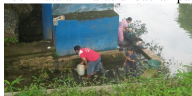
Gambar 2. Pemanfaatan sumber mata air untuk sarana MCK di tempat sekaligus menampung dengan jerigen untuk keperluan di rumah