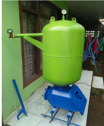
Gambar 6. Bentuk fisik mesin dongki