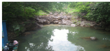
Gambar 1. Sumber mata air Paras di daerah padas dan berbatu