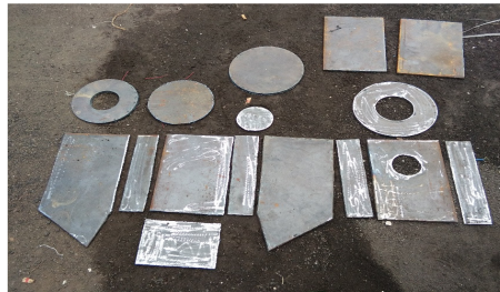
Gambar 4. Hasil potong plat besi

Selanjutnya, potongan plat besi yang telah diratakan digabungkan dengan proses pengelasan untuk mendapatkan bentuk ruang kompresi air. Dilanjutkan dengan proses pembuatan katup pintu pembuangan air yang terdapat pada bagian depan pompa. Bagian ini merupakan bagian utama dari mesin dongki. Pada proses ini, perlu dilakukan proses perataan permukaan katub pintu agar tidak terjadi kebocoran tekanan air. Bagian katub pintu ini dibuat terpisah dari bagian ruang kompresi untuk kemudian digabungkan dengan menggunakan mur-baut untuk mempermudah proses perawatan mesin dongki. Proses selanjutnya adalah pembuatan katub penampungan air yang berfungsi untuk menampung air pada saat pelepasan kompresi air pada pompa dengan bantuan tabung sebagai media hidrostatik. Katub ini dilekatkan secara permanen dengan ruang kompresi air dengan pengelasan. Setelah katub penampungan air tersambung dengan baik, dilanjutkan dengan pembuatan penampang penghubung tabung hidrolik. Tabung ini dilengkapi dengan pipa saluran air beserta water valve dan barometer. Selanjutnya ruang kompresi yang telah tersambung dengan katub pembuangan dan penampungan air disatukan dengan tabung dengan menggunakan mur-baut.