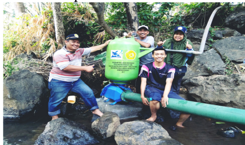
Gambar 5. Pompa Air Dongki Telah Terpasang di Sungai Paras

Target setelah pemasangan pompa air dongki adalah pompa ini mampu menghasilkan debit luaran air lebih kurang 10 liter per menit, sehingga per hari mampu menyalurkan 14.400 liter (10 liter x 60 menit x 24 jam). Jika kedua wilayah mitra terdiri dari 115 KK, maka dengan pengaturan yang baik dapat diasumsikan bahwa setiap KK akan mendapatkan 125 liter air bersih per hari.