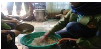
Gambar 9. Proses pengadukan adonan.