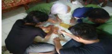
Gambar 11. Proses penggilingan dan pengirisan