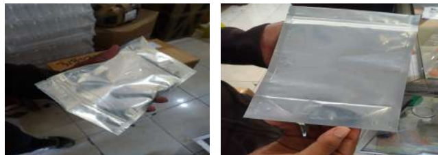
Gambar 16. Kemasan baru 150 gram

Sesuai dengan tema KKN Tematik kali ini fokus pengembangan dititik beratkan pada abon bandeng tetapi dari abon bandeng tersebut ada inovasi pemanfaatan limbah duri ikan bandeng. Hanya ada satu UKM yang menghasilkan produk abon bandeng yang dikelola oleh Ibu Khasibah. Kemasan yang digunakan selama ini sangat sederhana dan tidak menjamin keamanan produk. Maka dari itu dilakukan pendampingan pada produk abon bandeng Ibu Khasibah sehingga memiliki kemasan yang lebih baik dan menambah nilai jual produk tersebut.