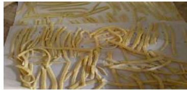
Gambar 12. Hasil pengirisan