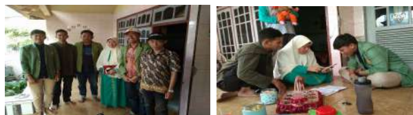
Gambar 19. Kegiatan pendampingan pemasaran online

Selain dilakukan penyuluhan tentang kemasan juga dilakukan Pendampingan Pemasaran Online di hari dan tanggal yang berbeda. Setelah dilakukan pendataan UKM mana saja yang ingin mendapat pendampingan tanggal 3-4 Agustus maka langsung dilaksanakan kegiatan pendampingan pemasaran dan promosi online bagi UKM. Sesuai dengan rencana kegiatan ini fokus kepada Ibu Khasibah sebagai UKM sasaran. Hari pertama dilakukan pendampingan terkait pemasaran online melalui instagram, maupun tokopedia