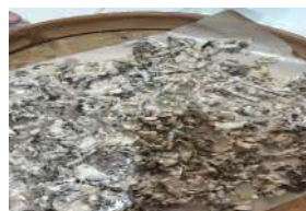
Gambar 4. Duri ikan bandeng diletakkan di nampan atau tampah