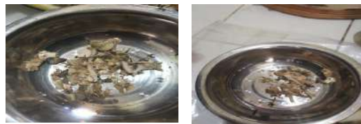
Gambar 3. Duri ikan bandeng yang telah dipisahkan