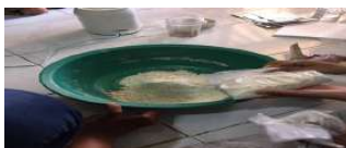
Gambar 7. Proses pencampuran