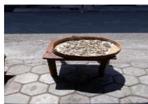
Gambar 5. Duri ikan bandeng dijemur hingga kering