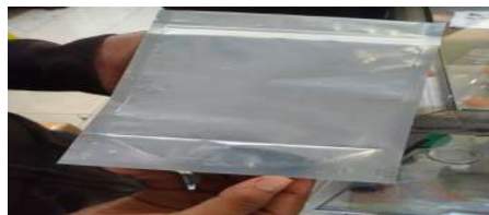
Gambar 15. Desain Kemasan

Kegiatan ini kelompok 4. KKN-Teamatik merancang dalam pembuatan desain yang rencananya untuk hasil produksi stik duri ikan bandeng. Kita tahu bahwa kemasan produk makanan di pasar industry sangat beragam dan unik sehingga memiliki nilai jual tinggi. Contoh plastic yang selanjutnya di desain.