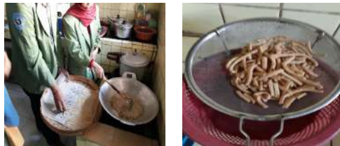
Gambar 13. (Kiri) Proses penggorengan (Kanan) Hasil akhir

Berdasarkan rangkaian tersebut diatas, maka pembuatan stik duri ikan bisa dilanjutkan dengan melakukan tindakan dalam memasarkan produk tersebut.