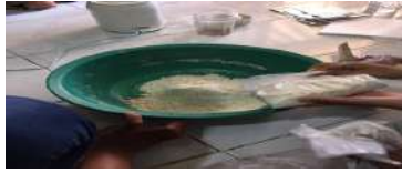
Gambar 10. Pencampuran soda kue.