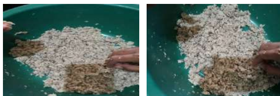
Gambar 6. Duri bandeng yang sudah diblender dan menjadi tepung

Tepung duri bandeng yang telah dibuat dapat digunakan sebagai bahan dalam pembuatan beberapa macam inovasi produk camilan. camilan tersebut diantaranya kerupuk dan stik yang mengandung kalsium tinggi sehingga dapat memiliki nilai jual untuk dipasarkan.