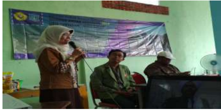
Gambar 14. Sosialisasi Tentang kewirausahaan, Pemasaran dan Kemasan

Kegiatan ini kelompok 4. KKN-Teamatik merancang dalam pembuatan desain yang rencananya untuk hasil produksi stik duri ikan bandeng. Kita tahu bahwa kemasan produk makanan di pasar industry sangat beragam dan unik sehingga memiliki nilai jual tinggi. Contoh plastic yang selanjutnya di desain.