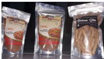
Gambar 17. Hasil akhir kemasan abon bandeng dan Banone stik (stik duri ikan bandeng) Inovasi Pemasaran

Produk yang dihasilkan oleh UKM di wilayah RW 1 Kelurahan Gunung Anyar Tambak sangat beragam. Sesuai dengan potensi wilayah di bidang perikanan sehingga UKM yang berkembang di wilayah ini pun juga menghasilkan produk olahan hasil laut. Mulai dari kerupuk ikan dan udang, sempol, terasi, petis, bandeng sapit dan abon bandeng.