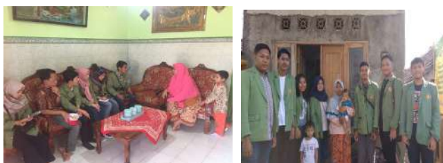
Gambar 1. Kegiatan wawancara

Salah satu limbah dari UKM yang biasanya dibuang dan tidak dimanfaatkan adalah duri dari ikan bandeng. Duri ikan bandeng dapat diperoleh dari UKM pengolahan ikan bandeng menjadi abon bandeng atau dari penjualan ikan bandeng tanpa duri (cabut duri) yang melimpah. Duri ikan bandeng biasanya dibuang tanpa dimanfaatkan menjadi produk yang berharga. Misalkan duri ikan bisa dijadikan tepung duri ikan bandeng lalu dapat digunakan sebagai bahan dasar olahan aneka camilan seperti kerupuk, stik, dan lain-lain.