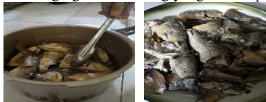
Gambar 2. Ikan bandeng yang telah dipresto siap dipisahkan durinya