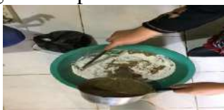
Gambar 8. Proses pencampuran margarin yang dipanaskan